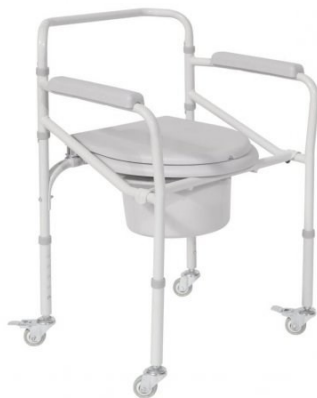
Toaletná stolička – 5 € / mesiac