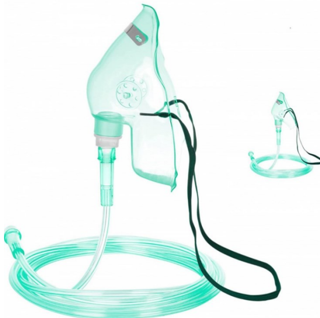
Oxygenátor veľký (10L) - 50 € / mesiac + maska