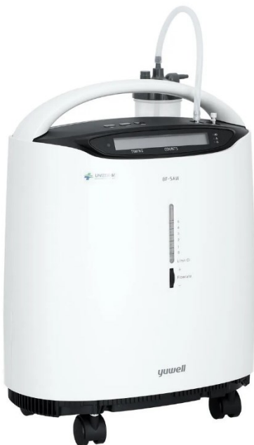
Kyslíkový koncentrátor – 40 € / mesiac + maska