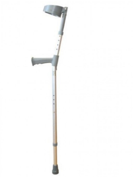
Barle francúzske – 4 € / mesiac