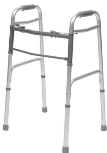
Chodítko pevné – jednoduché - 7 € / mesiac