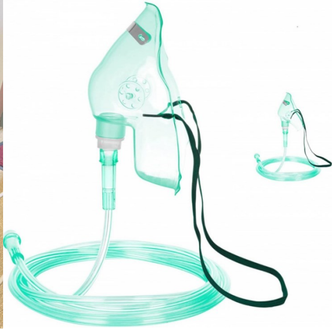
Oxygenátor malý (5L) - 40 € /mesiac + maska