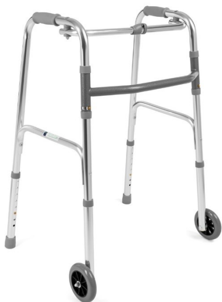
Chodítko na kolieskach - 7 € / mesiac