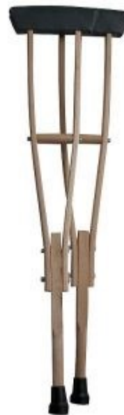
Barle nemecké – 4 € / mesiac