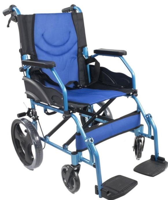
Invalidný vozík - 15 € / mesiac